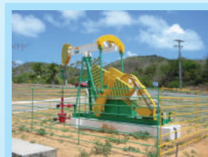
Bombeador mecânico da Petrobras.