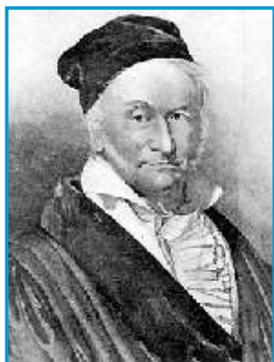
Carl Friedrich Gauss.

No século XVIII, Leonardo Euler (1707-1783) usou o símbolo i para representar \sqrt{-1} .